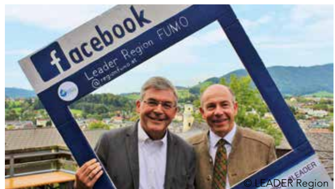
Landesrat Schwaiger und Landesrat Hiegelsberger beim Obleutetreffen der LEADER Region

Genauer nachzulesen sind diese und zahlreiche weitere Aktivitäten auf der Website der LEADER-Region FUMO: www.regionfumo.at